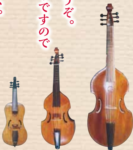
左より:トレブル、テノール、バス