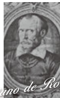
Cipriano de Rore